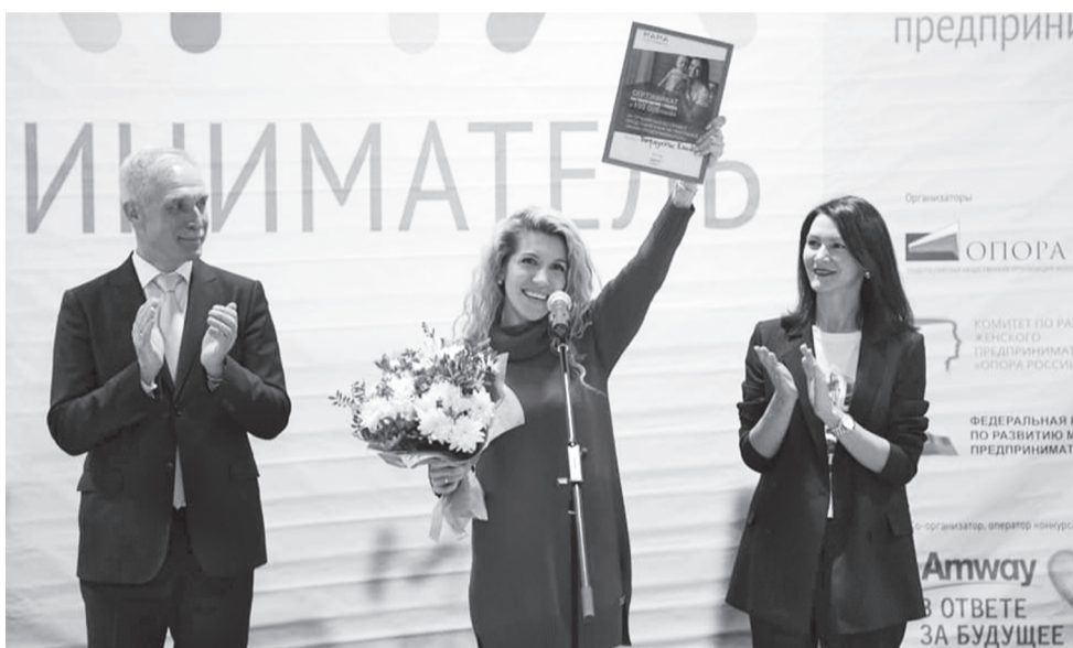
Образовательный проект «Мама-предприниматель» разработан специально для женщин в декретном отпуске, матерей несовершеннолетних детей, а также женщин, находящихся на учете в службе занятости. Цель проекта - помочь им начать собственное дело и воплотить в жизнь бизнес-идеи, реализовать которые не удавалось самостоятельно. Бесплатное обучение проходит в форме пятидневного тренинга-интенсива с погружением в деловую среду, разработкой бизнес-планов и менторской поддержкой. Заключительный этап обучения - конкурс бизнес-проектов участниц. Экспертное жюри оценивает их экономическую обоснованность, оригинальность и социальную значимость. Победительница получает грант на открытие собственного дела.

Одна из важнейших задач в рамках реализации нацпроекта «Малое и среднее предпринимательство и поддержка индивидуальной предпринимательской инициативы», неделя которого завершается в Ульяновской области, заключается в формировании положительно-